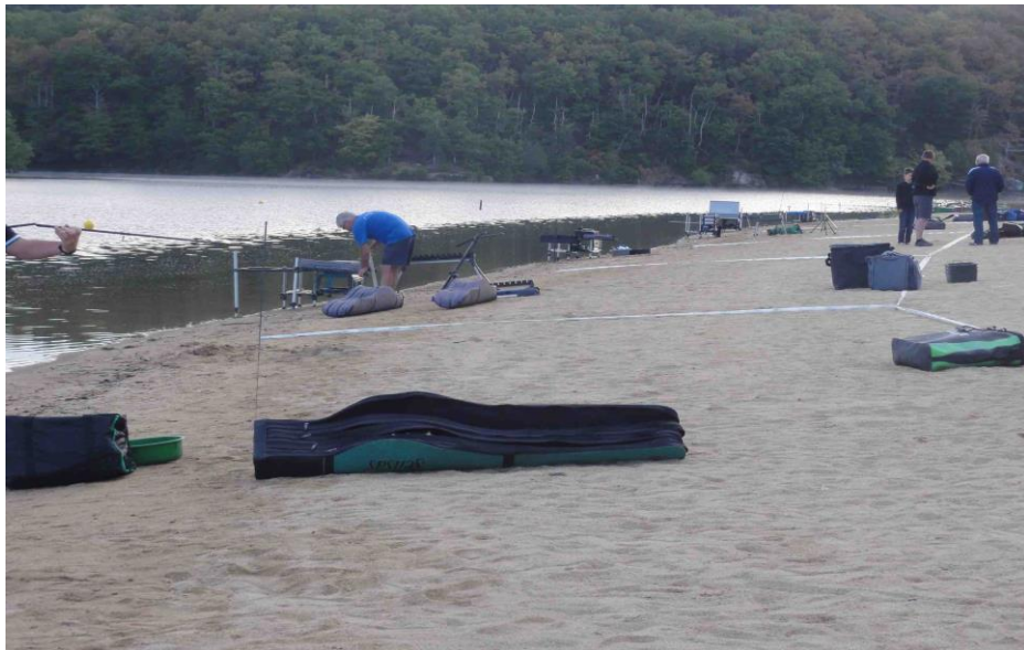
SECTEUR ANZEME PLAGE