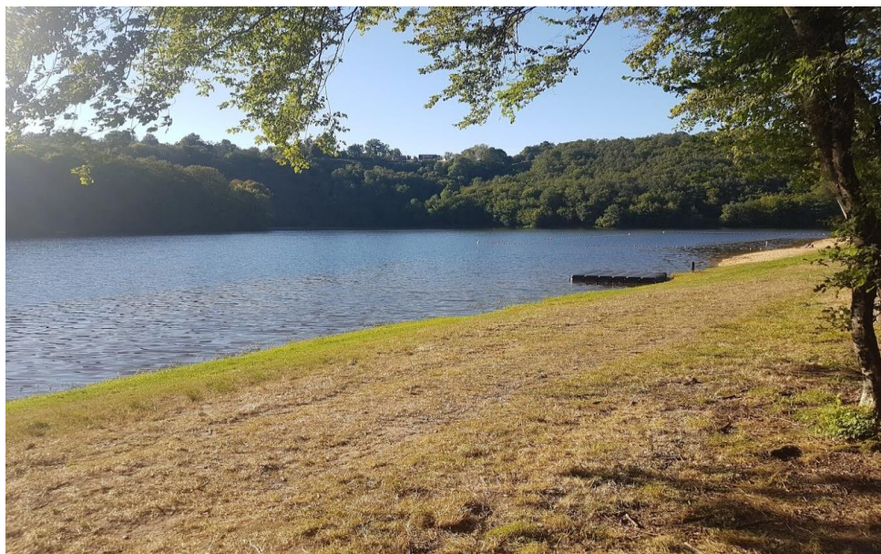
SECTEUR BOURG D'HEM (amont plage)