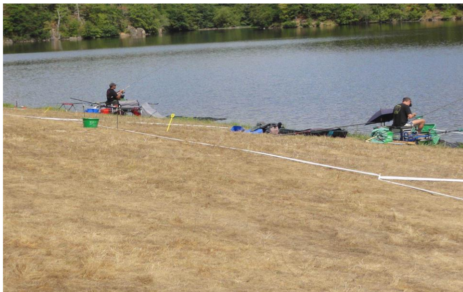
SECTEUR ANZEME PRE/BOIS