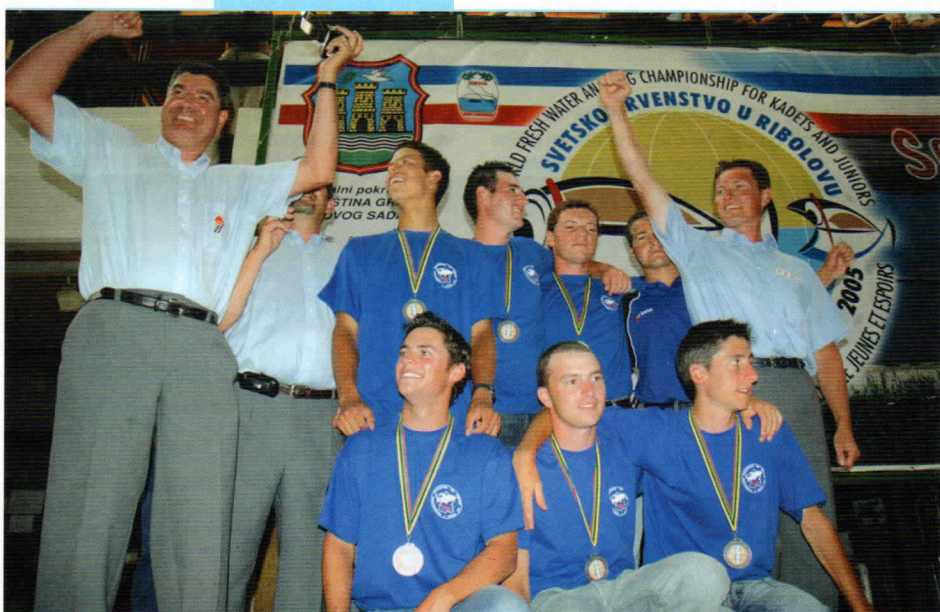
"L'argent... après l'or de 2004..."